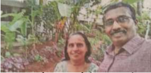
മനോരമ ദിനപ്പത്രത്തിൽ വന്ന വാർത്ത.